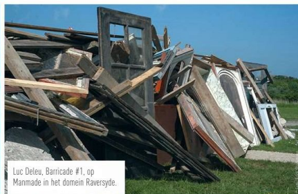
Luc Deleu, Barricade #1, op Manmade in het domein Raversyde.